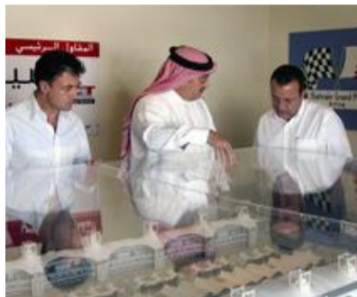
Jean Alesi (links) schaut sich die Rennstrecke im Modell an