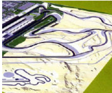
Der Wüstenkurs in einer Computer-Animation

Mit dem Grand Prix von Bahrain feiert die Formel 1 in diesem Jahr ihr Debüt auf der arabischen Halbinsel. Am 4. April kämpft die PS-Elite erstmals um den Sieg auf dem neu erbauten Bahrain International Circuit in Manama.